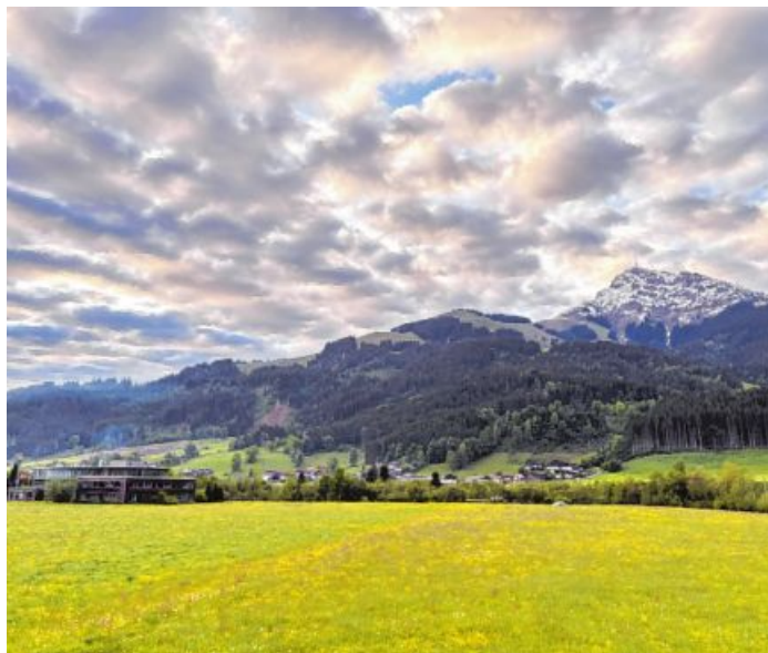
Fantastischer Blick auf das Kitzbüheler Horn und Penzing in Oberndorf in Tirol. Hannes Nothdurfter war schon frühmorgens mit der Kamera unterwegs.

Die hier publizierten Leserbriefe geben nicht die Ansicht der Redaktion, sondern nur die des Verfassers wieder. Im Interesse der Meinungsvielfalt behält sich die Redaktion Kürzungen vor. Bitte geben Sie Ihren vollen Namen und die Adresse sowie für allfällige Rückfragen Ihre Telefonnummer an. Tiroler Tageszeitung, Abteilung Leserbriefe, Brunecker Straße 3, 6020 Innsbruck oder leserbriefe@tt.com