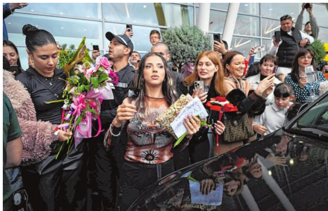
Millionen Menschen verfolgten die gigantische Show des Eurovision Song Contests vergangenen Samstag in Wien. Die Popsängerin Dara holte den Sieg, damit findet der nächste Song Contest in Bulgarien statt.

Darüber nachdenken, wie viel Geld und Aufwand für solche Veranstaltungen aufgewendet werden und was man damit sonst Sinnvolles machen könnte, darf man ohnehin nicht. Trotzdem muss man solche Events auch wieder positiv sehen. Die Menschen lenken sich ab, fiebern mit und begeistern sich für etwas — auch wenn es objektiv gesehen oft ziemlich trivial erscheint. Im Grunde kann man das auch mit Fußball- oder Sportfans vergleichen. Viele identifizieren sich so stark mit ihrem Verein, dass Freud und Leid vom Ausgang eines Spiels abhängen. Daran erkennt man,