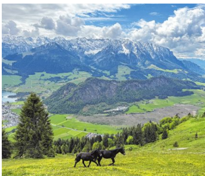
Die ersten Tiere sind schon auf der Alm. Margit Huber aus Radfeld hat das Foto auf dem Weg zum Brennkopf, mit Blick auf das Kaisergebirge, aufgenommen.