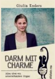
Giulia Enders, „Darm mit Charme“. Ullstein, akt. Ausgabe 2017, 302 Seiten, € 17,50

Er achtet darauf, dass der Körper versorgt wird und gesund bleibt. Trotzdem werde er meist sträflich vernachlässigt, moniert Giulia Enders: „Der Darm, so glauben die meisten, geht höchstens mal aufs Klo.“ Wie komplex und faszinierend die Welt der lebenswichtigen mikrobiellen Untermieter ist und wie wir ihre Wohnung vor ungebetenen Gästen schützen können, beschreibt die deutsche Internistin anschaulich und mit Sinn für Humor. Noch nie war es so kurzweilig, den Darm kennenzulernen. (gueb)