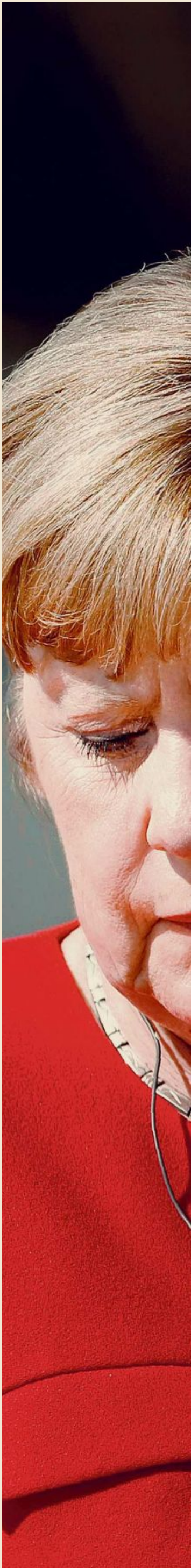
Angela Merkel fehlt es in der EU-Politik etwas an Großzügigkeit.

Wer wäre also besser für die gemeinsame Zukunft in der Europäischen Union? Vermutlich eine Mischung aus beiden Politikern mit ihren jeweils sehr speziellen EU-Erfahrungen. Dem lauten europäischen Romantiker Schulz würde die Regierungserfahrung und die vernünftige Kontrolliertheit der Kanzlerin guttun. Die risiko- und visionsarme Merkel könnte einiges von der Leidenschaft, der rhetorischen Kraft des SPD-Chefs brauchen. Vielleicht kommt das sogar, sollte Merkel Kanzlerin bleiben und Schulz etwa Außenminister und ihr EU-Antreiber werden. Das Gespann würde in gewisser Weise an Kohl und Hans-Dietrich Genscher erinnern.