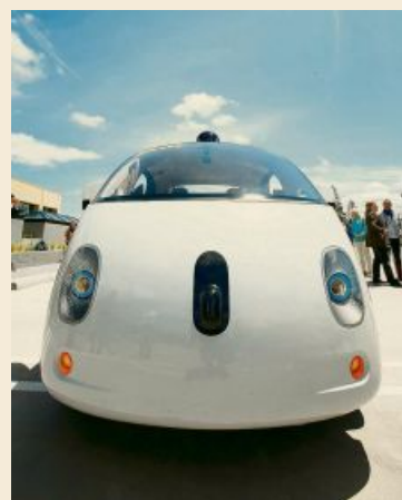
Prototyp eines selbstfahrenden Autos von Google.

Im Sommer 2015 war das Erstaunen kaum geringer, nachdem der Internethändler Amazon bei der Marktkapitalisierung am Einzelhandelsgiganten Wal-Mart vorbeigezogen war. Inzwischen sind