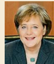
Merks erste Kabinettsitzung im November 2005.

In der dritten Amtszeit begann auch ihre härteste Prüfung: Ab Sommer 2015 arbeitete Merkel fast ausschließlich an den Folgen der Flüchtlingskrise, die ein tiefes Zerwürfnis mit der CSU zur Folge hatte. Dennoch hat sie noch nicht genug, sie ist bereit für Teil vier – wenn die Wähler wollen. (bau)