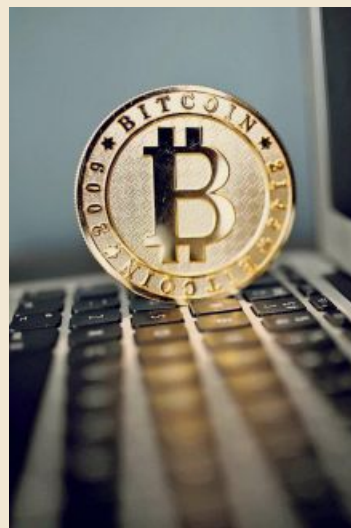
Vom Computer in die reale Welt: Das hat der Bitcoin geschafft.

Dann kam die Nachricht, dass China daran denkt, Spekulationen mit dem Internetgeld zu unterbinden. Börsengänge von Kryptowährungen – sogenannte Initial Coin Offerings (ICOs) – wurden bereits verboten. Unternehmen dürfen damit kein eigenes Geld mehr am Computer schaffen. Zudem soll die chinesische Bitcoin-Börse BTC China geschlossen werden. Das hat den Kurs rasant abstürzen lassen. Genauso schnell hat er sich aber auch wieder erholt.