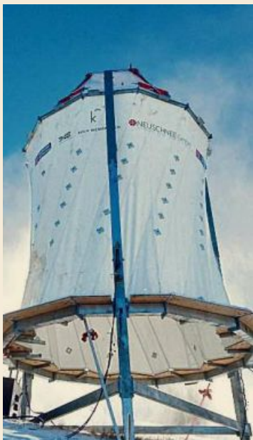
Derzeit wird die künstliche Wolke in Obergurgl getestet.

Die neue Art der Schneeerzeugung feiert 2017 ihre Markteinführung, noch laufen Tests